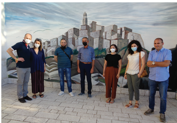
Foto di gruppo all'inaugurazione del "Borgo della Lettura" davanti all'opera dell'artista Francesco Muccino

In bocca al lupo a tutti gli alunni che si avvicineranno a questo strumento.