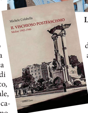
La presentazione del libro nel giardino del Convento. A lato: la copertina del libro

demandare per non assumersi neanche la responsabilità di tramandare ai figli la memoria e le colpe derivanti da quel periodo storico.