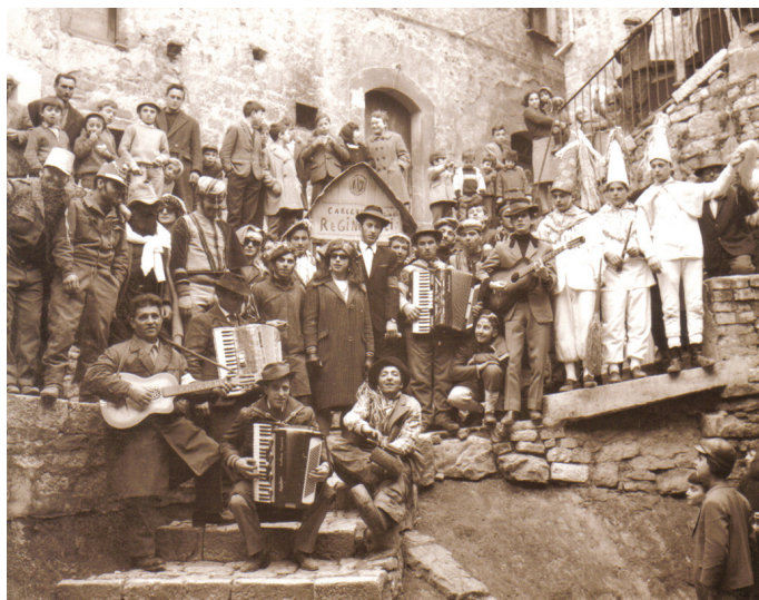
Foto di gruppo della Mascherata 1967

Ma sarà sicuramente la carica di ottimismo e di ironia tipica della nostra Mesquerate a portarci a reagire di fronte agli scherzi della vita. E a riportare quanto prima le melodie dei mandolini, le risate e le canzoni, tra le vie del borgo.